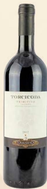
Primitivo Torcicoda R$ 298,00