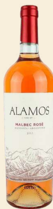
Alamos Malbec Rosé R$ 129,50