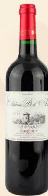
Chateau Bel Air Bordeaux R$ 179,00