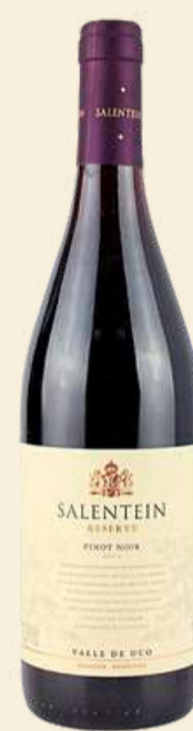
Salentein Reserva Pinot Noir R$ 185,00