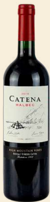
Catena Malbec R$ 199,00