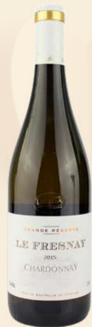
Le Fresnay Gran Reserva Chardonnay R$ 116,00